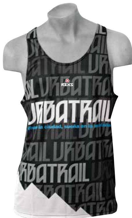
Modelo tirantes Corte recto sin entallar Disponible en varios tejidos