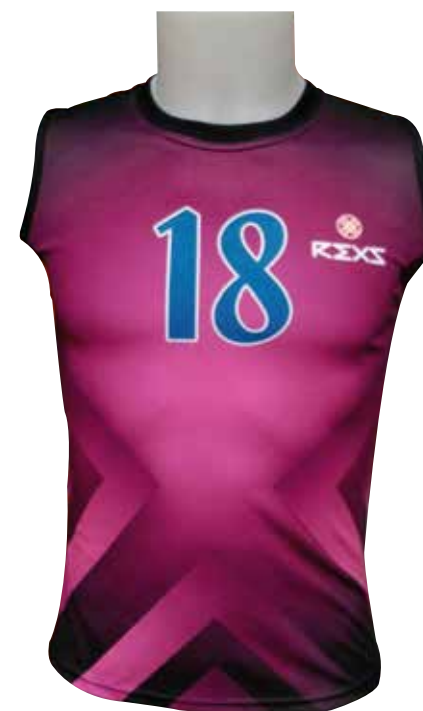
Modelo sin mangas Corte recto sin entallar o entallado Disponible en varios tejidos